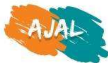
ASSOCIAÇÃO DE JOVENS DE ALPALHÃO