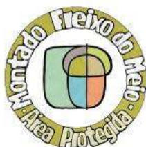
MONTADO FREIXO DO MEIO - ÁREA PROTEGIDA