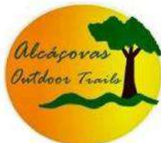
ALCÁÇOVAS OUTDOOR TRAILS